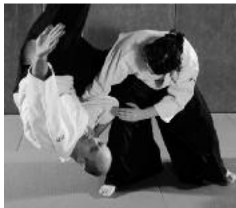
Flexibilité, anticipation et adaptation, fondamentaux de l'Aïkido.

Le dojo du Shiseikan se trouve au sein d'un parc d'environ 700 ha, au cœur de Tokyo, entre Yoyogi et Harajuku. C'est impressionnant lorsque l'on s'y rend car on a du mal à imaginer qu'il y a un endroit avec l'équivalent d'un bois dans le centre d'une des plus importantes métropoles du monde. L'atmosphère y est vraiment particulière car comme on est dans un cadre de nature et que l'on n'entend plus les bruits de la ville on a le sentiment d'être coupé de celle-ci. Pratiquer dans ce parc et au sein du Shiseikan m'a permis d'avoir un accès privilégié à une culture traditionnelle à laquelle je n'aurais pas pu accéder en tant que