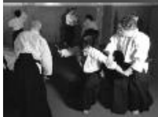
rencontre aïkido club daumesnil