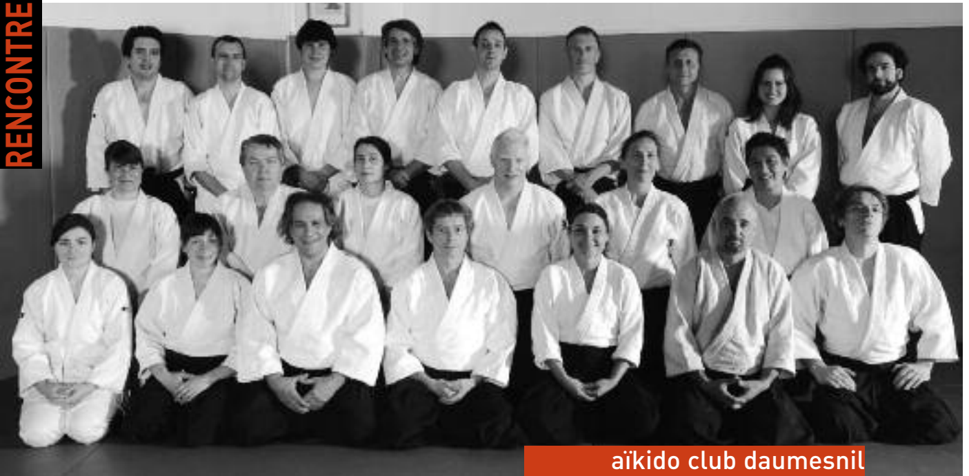
aikido club daumesnil